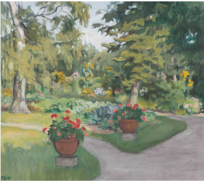
Gemälde vom Garten des Stäfner Wohnsitzes der Familie Gut-Hulftegger während der Anbauschlacht. Im Hintergrund ist ein Beet mit Kohl und anderen Gemüsen auszumachen.