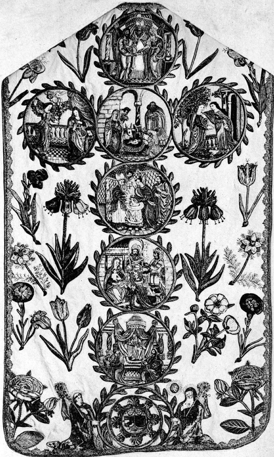
Gesticktes Meßgewand im Frauenkloster zu Seedorf.

Stiftung des Oberst Sebastian Heinrich Crivelli 1655.