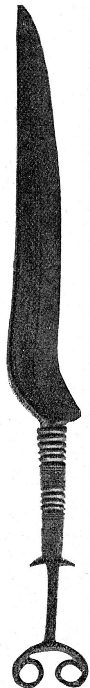
Abb. 1. Bronzemesser von der Jagdmatt. (1:2)

Der Bronzezeit, die in der Schweiz etwa von 1800 bis 750 vor Christus dauerte, gehören zwei schöne Funde an. Der eine betrifft das schon seit dem 17. Jahrhundert bekannte prächtige Bronzemesser, das in der Sakristei der Kapelle zur Jagdmatt in Erstfeld verwahrt wird 1) . Das zierliche Stück (Abb. 1), hat eine Länge von 28 cm. Klinge und Griff sind besondere Teile; beide sind reich mit Ornamenten ausgestattet und das Griffende trägt hübsch geschwungene Antennen. Wo und wann das Messer gefunden