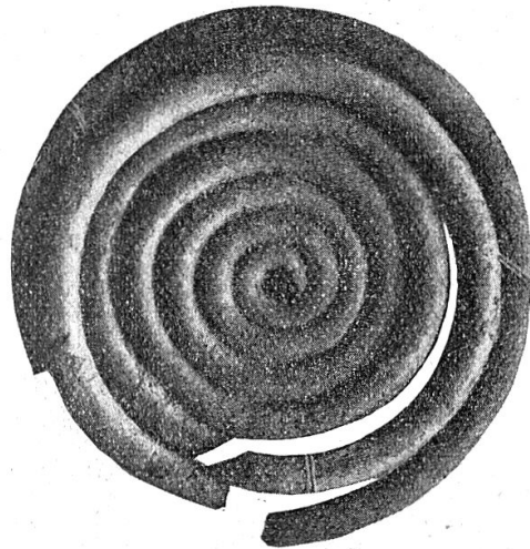
Abb. 3. Spirale eines Doppelspiralhakens aus Bürglen. (2:3)

Der zweite sehr wichtige Fund aus dem Bronzezeitalter wurde 1898 in Bürglen gemacht, als man die Klausenstraße baute. Dort stieß man, ziemlich in der Mitte des Dorfes, ganz nahe dem Sigristenhaus, von der Haustüre in gerader Richtung zur gegenwärtigen Straßenmauer, auf ein Grab oder wahrscheinlich mehrere Gräber. Es kamen eine Bronzenadel und ein Teil eines Doppelspiralhakens zum Vorschein; ferner wurde in der Nähe noch ein durchlochstes Tonkügelchen gefunden 1) . Die Nadel (Abb. 2), ist eine sogen. Wohnkopfnadel; ihre Spitze ist leider weg-