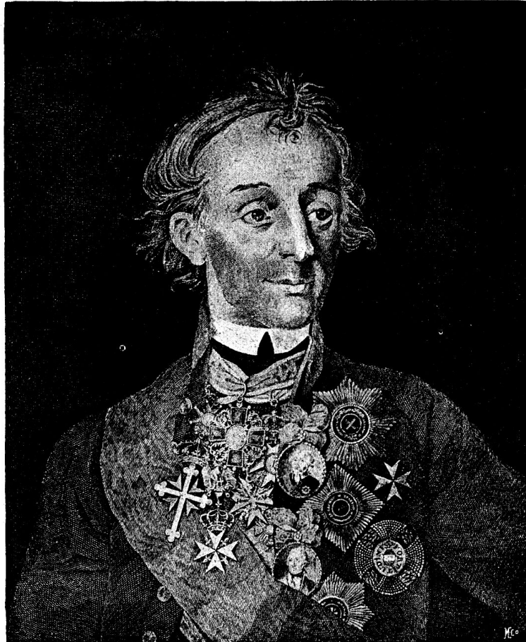
Generalfeldmarschall Graf Suworoff.

Erstlichens wieviel Geistliche in unserer Gemeinde seien, ihr Namensverzeichnis, Geburtsort, Alter und Stand, und ob sie im Lande seien oder nicht.