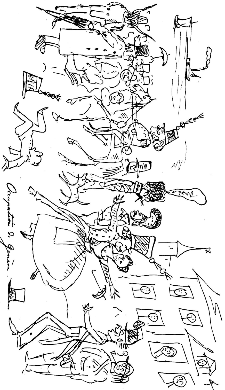
Occupation of Geneva.

Die eidgenössische Okkupation von Genf vom 23. August 1864 bis 11. Januar 1865 unter Platzherrnmandant Oberflethant Joseph Arnold von Allendorf. Nach einer gleichzeitigen Originalkarikatur, gezeichnet vom päpstlichen Zeuhant Albert de Kämg, Greiburg.