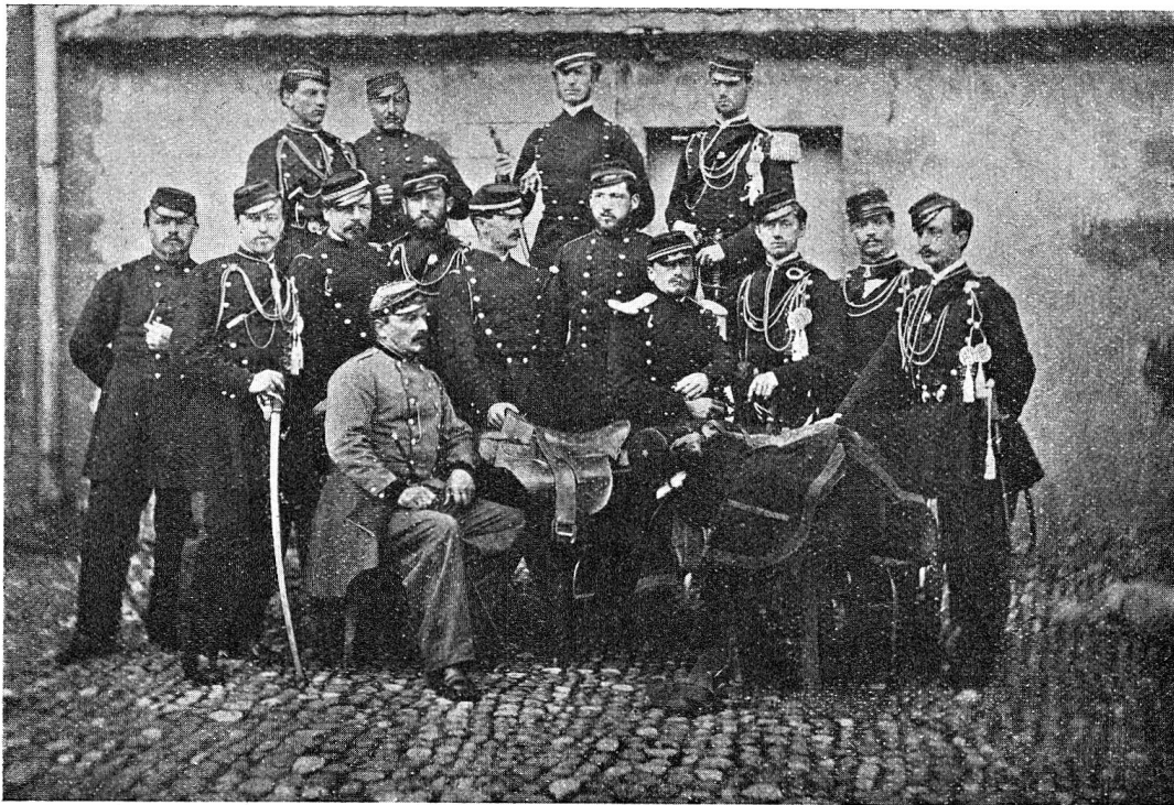
Schweizerischer Offizierskurs in Colombier 1866. (Siehe Anmerkung 2 auf Seite 85)