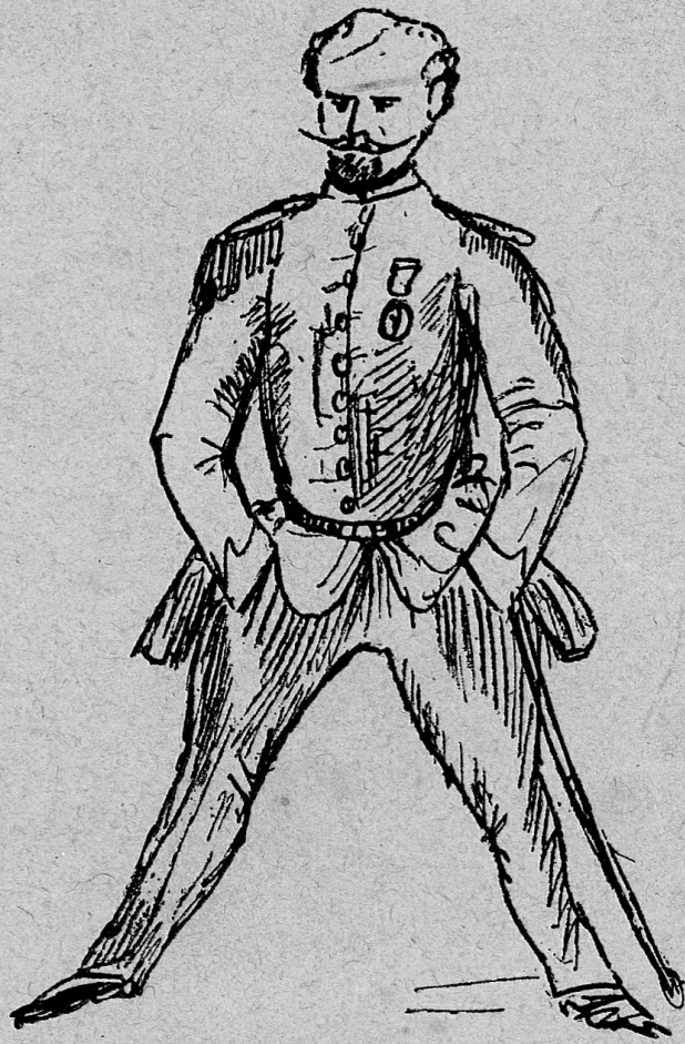
Ein päpstlicher Leutnant um 1864. Zeichnung von A. de Rámy.