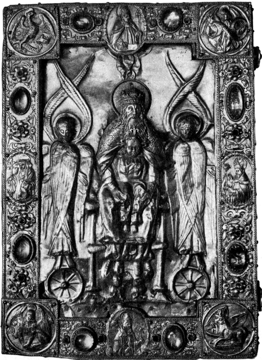
Deckel eines Plenariums im Stiftsschatz Luzern