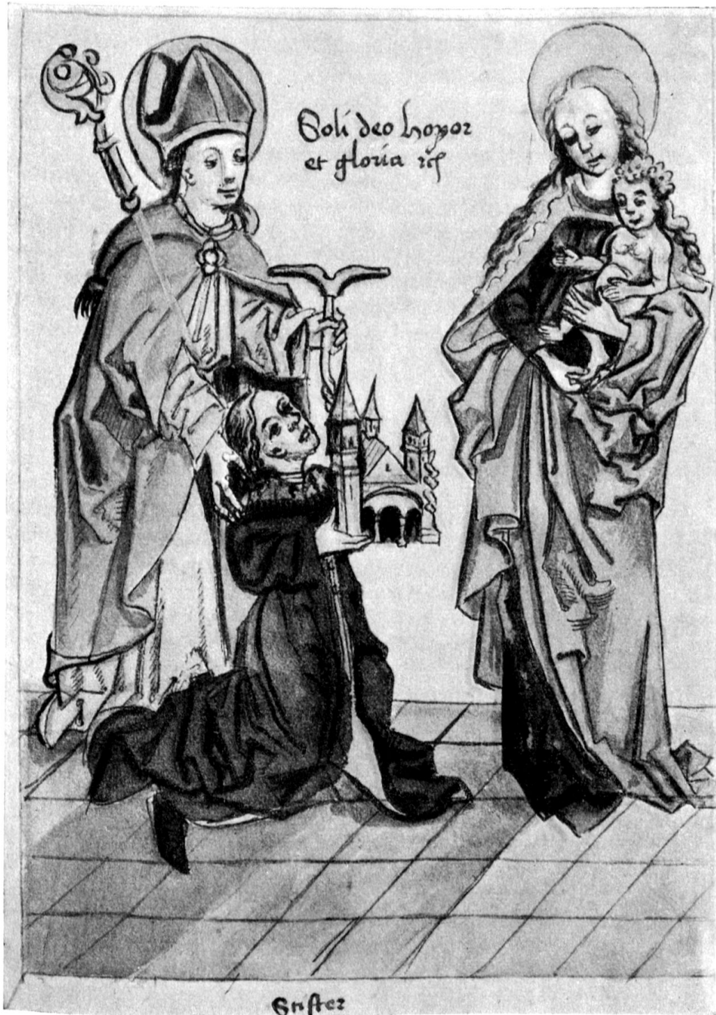
Abt Wichard weiht die Klosterkirche unserer lieben Frau