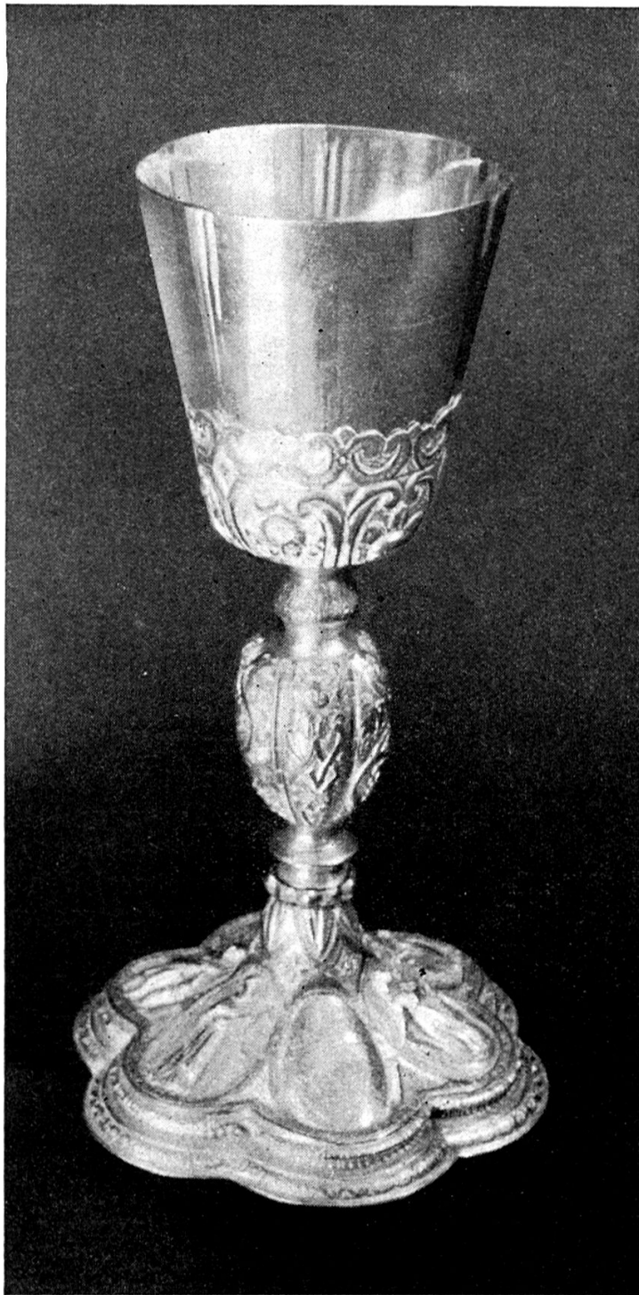
Der Beslerkelch (vor 1648)