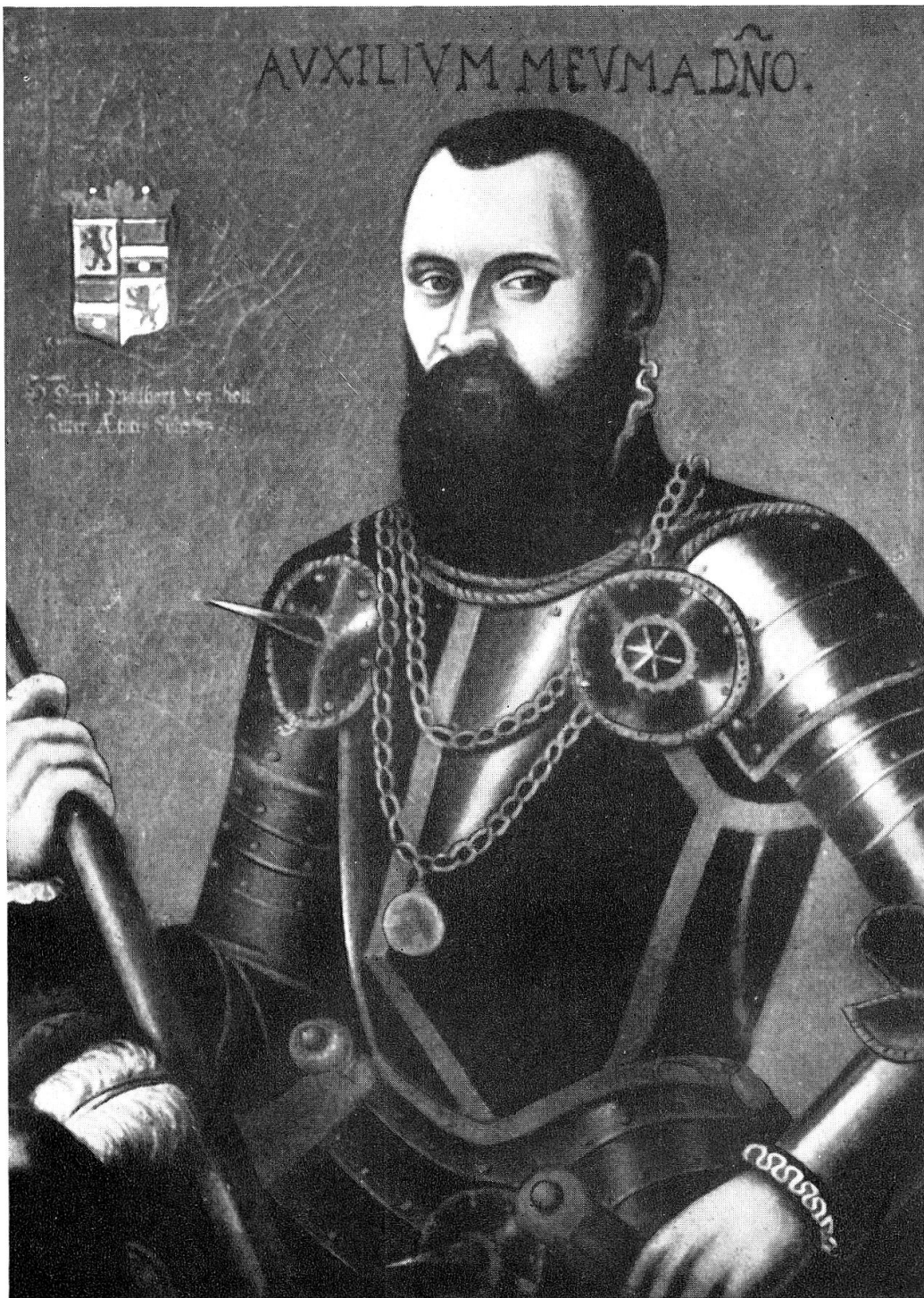
Ritter Walter von Roll († 1591) Porträt im Historischen Museum zu Altdorf