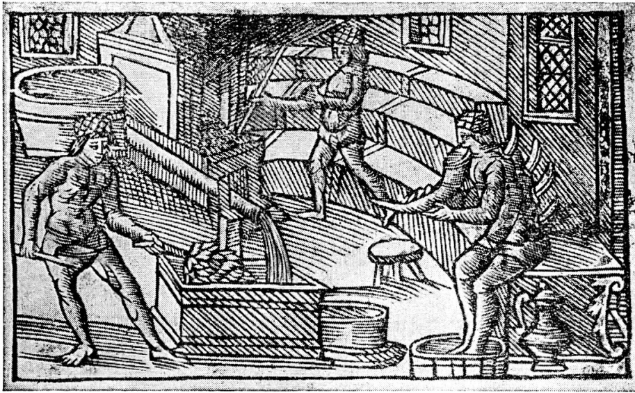
Badestube des 16. Jahrhunderts. Holzschnitt aus der « Historia de gentibus septentrionalibus » von Olaus Magnus (1490—1557). Rom 1955. *)

[Beim Fussbad wird der «Patient» gleichzeitig mit Schröpfhörnchen behandelt und mit einem Horn voll Heiltrank erquickt.]