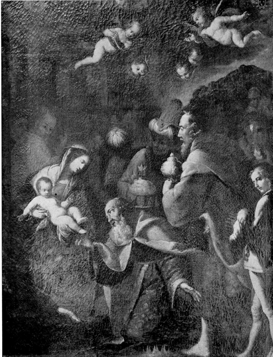
Dreikönigsaltar in der Jagdmattkapelle zu Erstfeld Wahrscheinlich von Karl Leonz Püntener