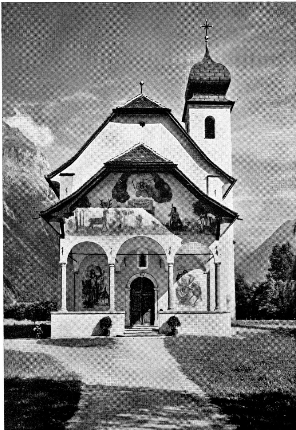
Jagdmattkapelle zu Erstfeld, erbaut 1637—1638 Giebelfresko aus dem 17. Jahrhundert