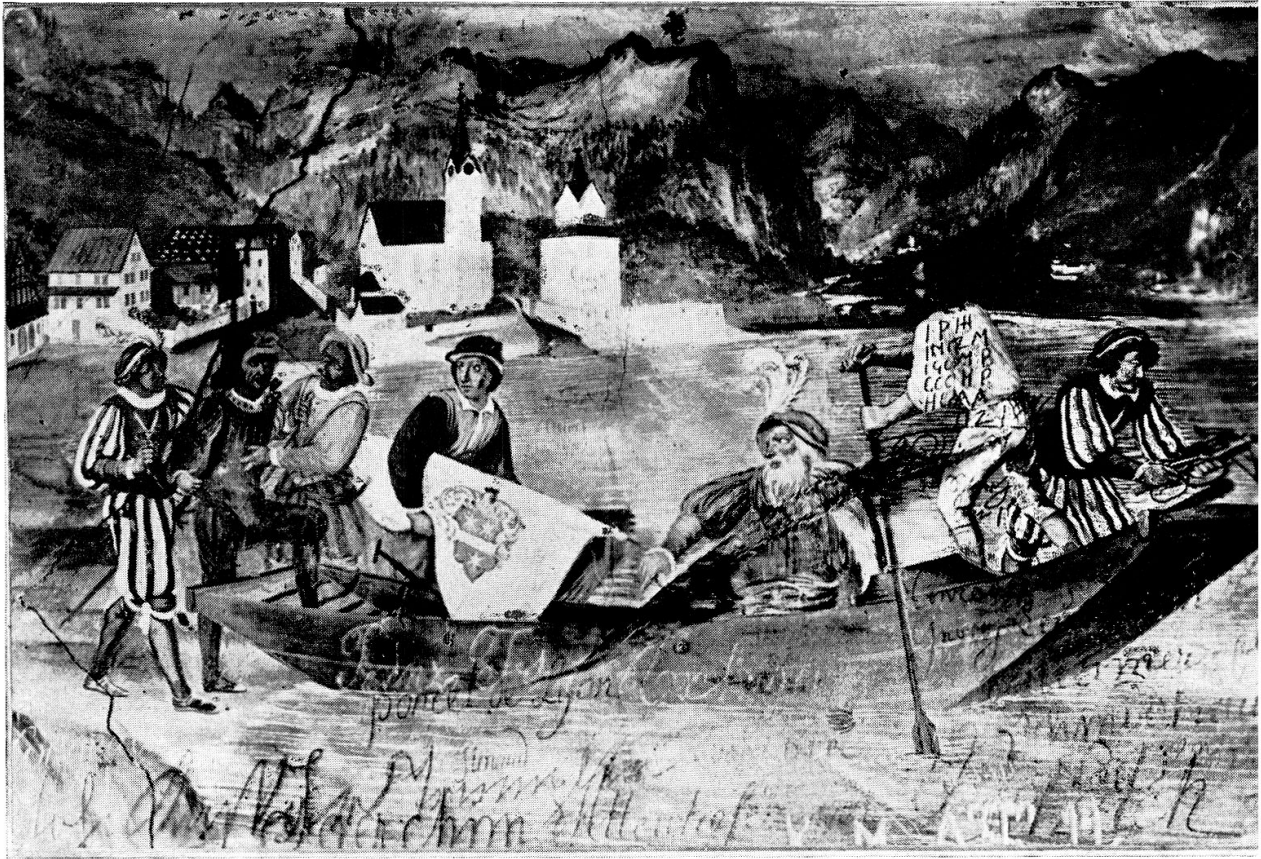
Der gefangene Tell besteigt in Flüelen das Schiff des Landvogtes Gessler Frescobild von Karl Leonz Püntener in der alten Tellskapelle