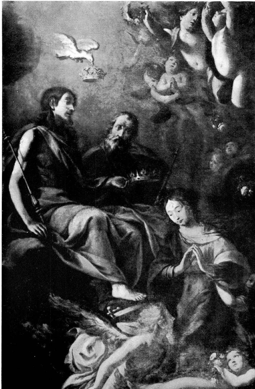
Hochaltar in der Jagdmattkapelle zu Erstfeld, 1689 Gemälde von Karl Leonz Püntener