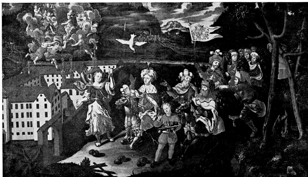
Die Klosterstiftung durch König Balduin