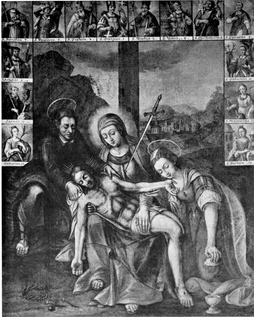
Pietà in der Taufkapelle der Pfarrkirche zu Erstfeld Kopie von Karl Leonz Püntener