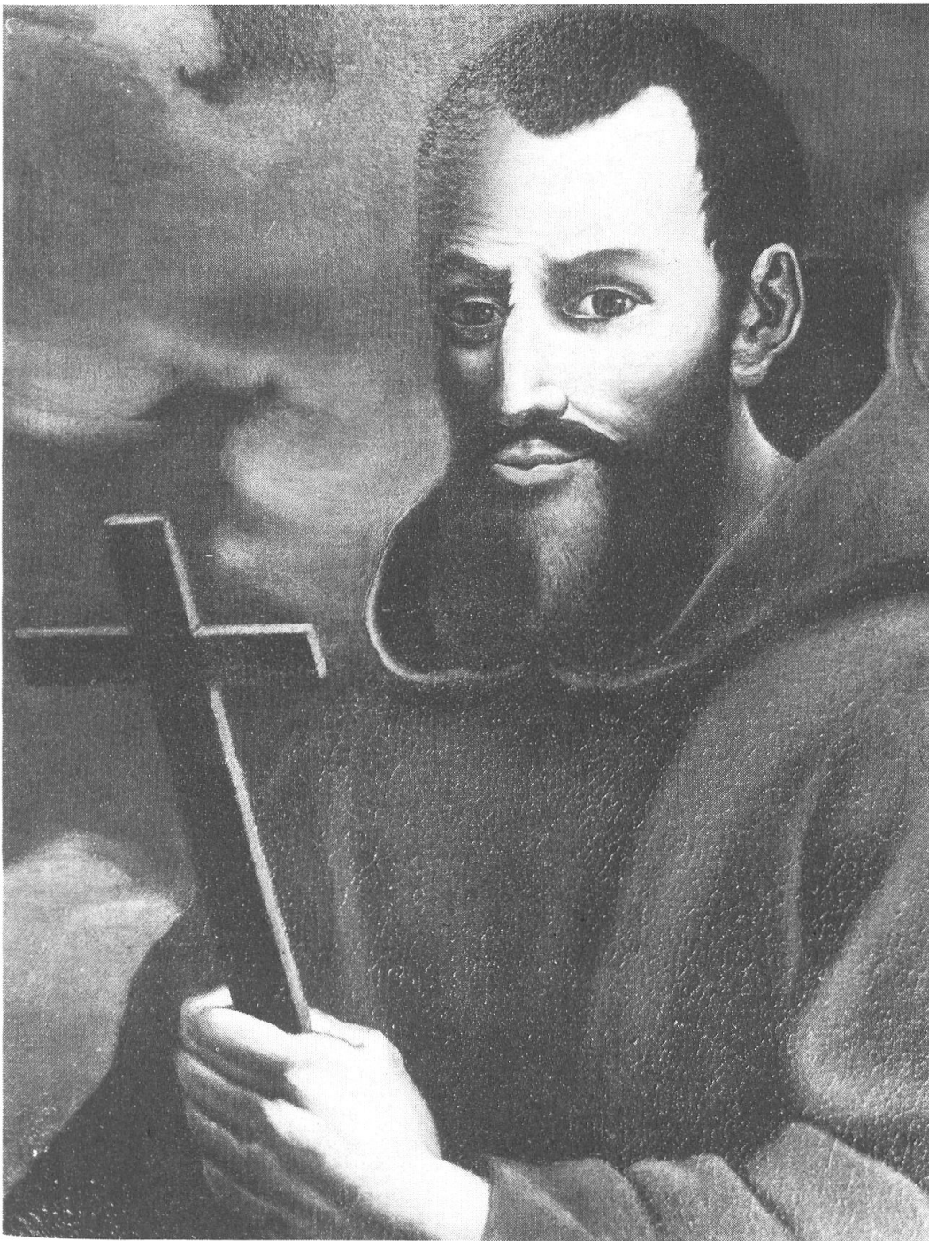
Der Provinzgründer Franz von Bormio

Gemälde, wahrscheinlich von Petrini, im Kapuzinermuseum Sursee.