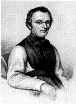
Pater Alberik Zwyszig. Ölbild.