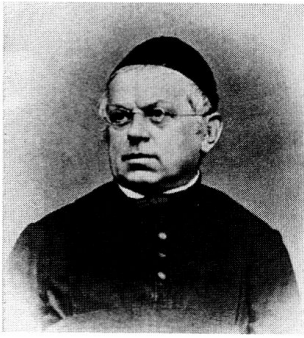
Pater Alois Zwyszig.

siklehrer. Wegen disziplinarischen Problemen innerhalb der Ordensgemeinschaft wurde das Kloster Pfäfers am 20. Februar 1838 mit Beschluss des Grossen Rates von St. Gallen aufgehoben. Pater Alois widersetzte sich erfolglos der Aufhebungsverfügung. Er verliess Pfäfers und kam als Lehrer an die Kantonsschule nach Altdorf. Auch hier bewegte er sich im musikalischen Bereiche; so soll er dem spätern Komponisten Gustav Arnold den ersten Klavierunterricht erteilt haben. Von 1843 bis zu seinem Tode wirkte er als geschätzter Klosterkaplan des Frauenklosters St. Anna im Bruch zu Luzern. 13