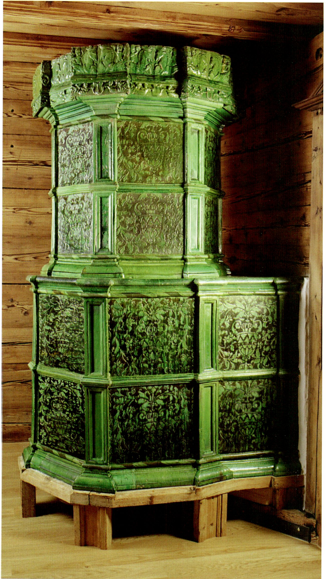
Abbildung 1: Turmofen von 1611/12 des Flüeler Hafners Heinrich Buchmann im Dachsaal. Aufnahme nach der Restaurierung.