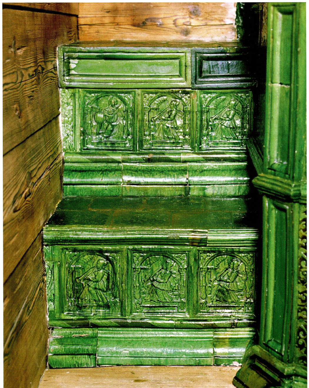
Abbildung 2: Turmofen in der Südstube von Hafner Heinrich Buchmann, datiert 1611.

Der Grundriss des Planzerhauses, 1910 im Bürgerhausband Uri publiziert, zeigt Lage und Grundfläche eines Kastenofens in der