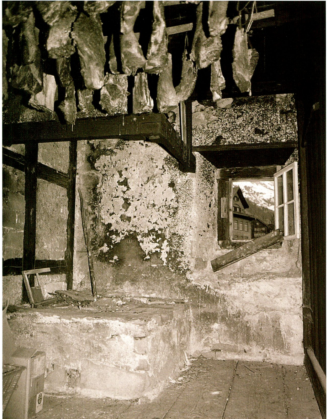
Abbildung 10: Rechts: Gemauerter Herd und Rauchfang in der Fleischkammer im Dachgeschoss. Aufnahme B. Furrer 1981.

durch die Küchen und Kammern über das Dach hinaus. Die Bauweise von Wellgrube und Rauchfang sowie der durchgehende Schornstein legen den Schluss nahe, dass im Parterregeschoss bereits im frühen 17. Jahrhundert gekäst worden ist. Lagergestelle für Käse säumten die firstparallelen Wände des südöstlichen Kellers (Abb. 8). Ob die Käseproduktion für den Hausgebrauch oder für den Export erfolgte, entzieht sich unserer Kenntnis. Sennereiräume im Kellergeschoss eines Patrizierhauses stellten in der damaligen Zeit keine Seltenheit dar. Solche Einrichtungen gab es unter anderem auch im Schlösschen Beroldingen (Seelisberg), im Redinghaus an der Strählgasse Schwyz oder in der Rosenberg in Stans. 18