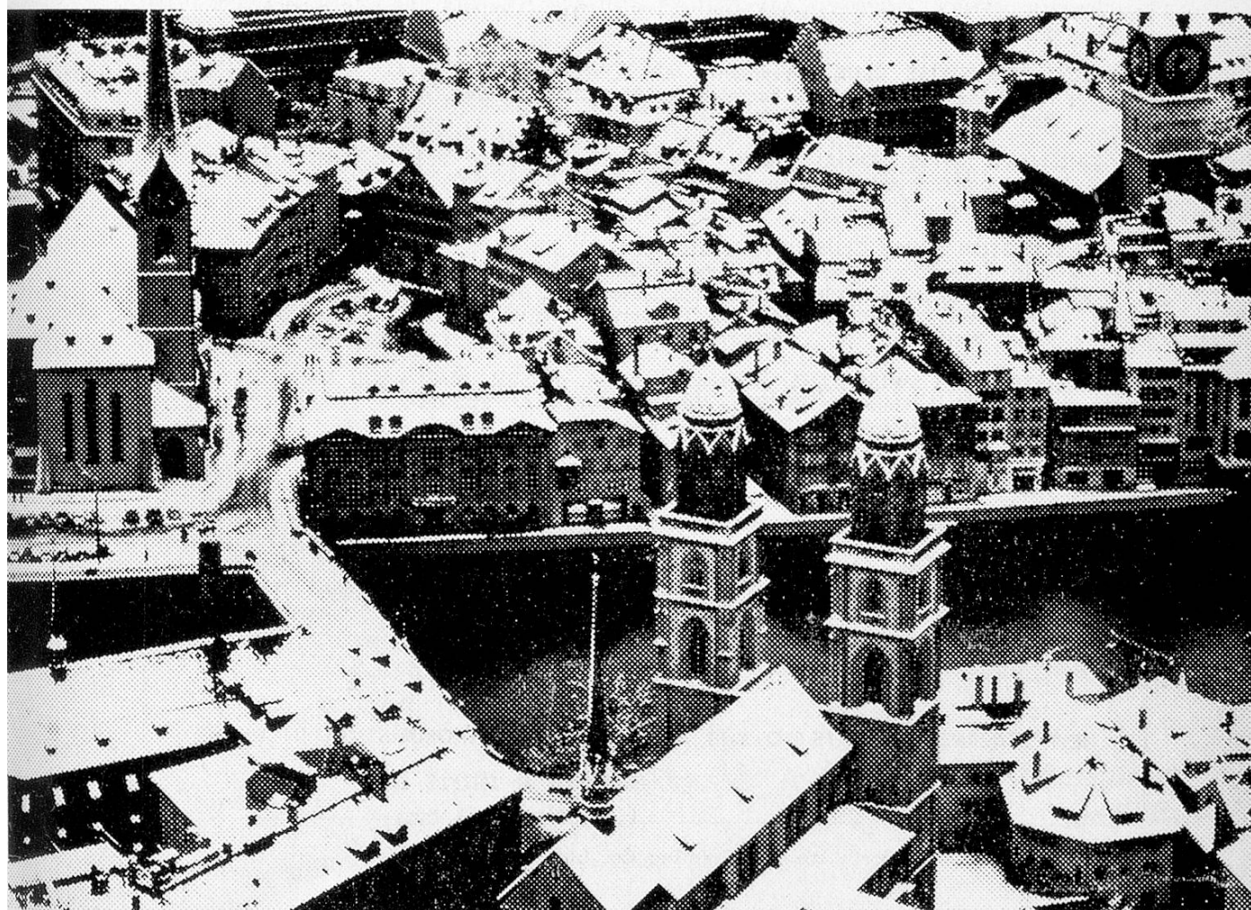
A view of Zurich.