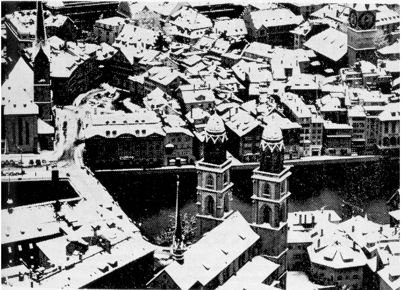
A view of Zurich.