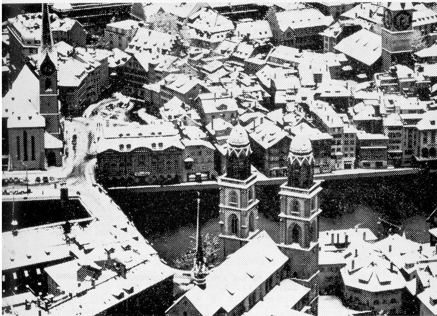
A view of Zurich.