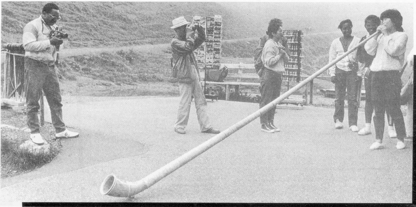
The Swiss alphorn has become a big attraction to foreign tourists. The picture shows some Japanese tourists on the Kleine Scheidegg trying their skill on this (to them) exotic instrument.