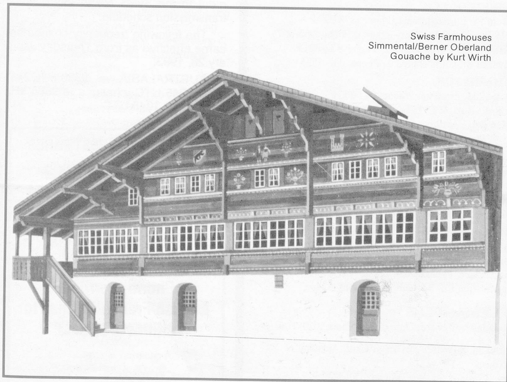
Swiss Farmhouses Simmental/Berner Oberland Gouache by Kurt Wirth

(Registered at the G.P.O. Wellington as a Magazine) Monthly Publication of the Swiss Society of New Zealand (Inc.) Group New Zealand of the Helvetic Society