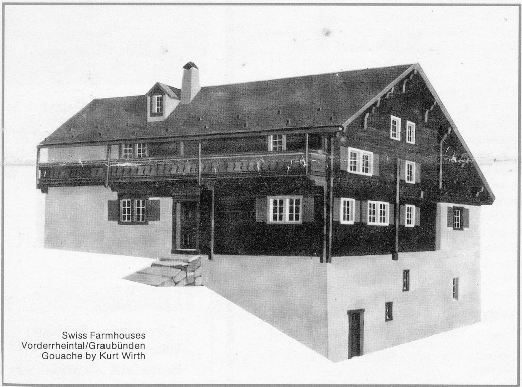
Swiss Farmhouses Vorderrheintal/Graubünden Gouache by Kurt Wirth

(Registered at the G.P.O. Wellington as a Magazine) Monthly Publication of the Swiss Society of New Zealand (Inc.) Group New Zealand of the Helvetic Society