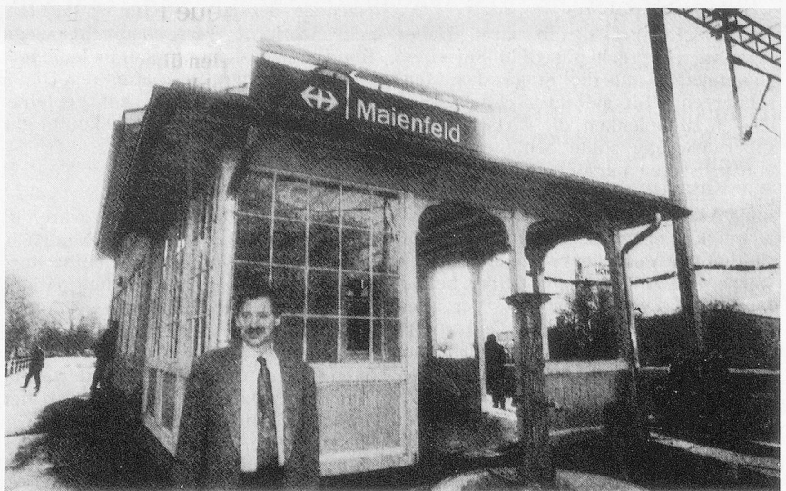
The Maienfeld railway station with its own, private station master who no longer works for the SBB but only for himself. He no longer wears the SBB regulation uniform either.

The SBB/CFF expect to turn over 250 small railway stations which are no longer commercially viable into "ghost stations". With no staff and no station master and only machines to sell tickets, these railway stations are electronically controlled by nearby major railway centres and therefore have become "ghost stations". But private enterprise and enthusiasm has resulted in some stations being taken over by individuals who run them at their own expense, collecting commissions from ticket sales. Tecknau in Basel, Nottwil in Lucerne, Bruggen in St Gallen and now Maienfeld in Graubünden are typical examples of stations saved from this modern trend of becoming "ghost stations". The case of Maienfeld is unique inasmuch as it has been taken over by the Railways Union itself, the first time the union has done so since its foundation 75 years ago.