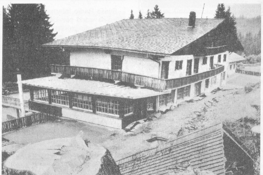
The "Berghotel" in July 1994, already slightly damaged by the moving mass.