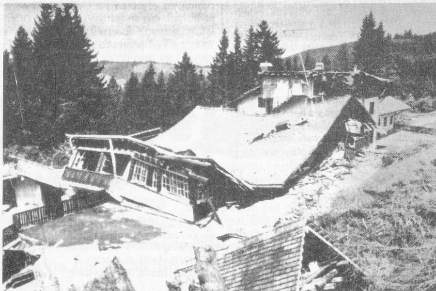
Same place 24 hours later.

some time ago, the slope on which the village was built started to move. In May 1994 some chalets had already sunk by several centimetres. Over 400,000 SFR were spent to stabilise the slope but to no avail. From then on, it was all downhill. Above the village the slope started to move by 70-80 centimetres a day and in the village itself by 10-15 centimetres. Over 10 million cubic-metres or some 25 million tons of earth were estimated to be in motion. Last June the village had to be evacuated.