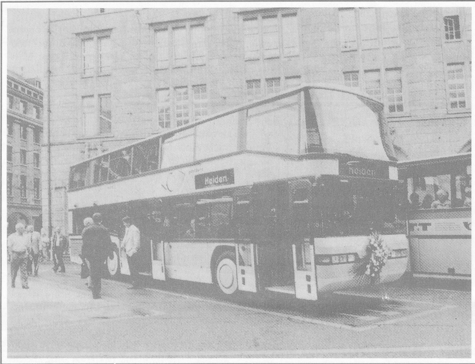
The double-decker PTT bus on its inaugural run next to the "old" conventional "Postauto".

The PTT have recently introduced this new "Postauto" service between St. Gallen and Heiden. The bus is of course a far cry from the so well known red London double-decker buses, but the principle is the same: to carry twice as many passengers for a same size bus, a welcome innovation on the very congested Swiss roads.