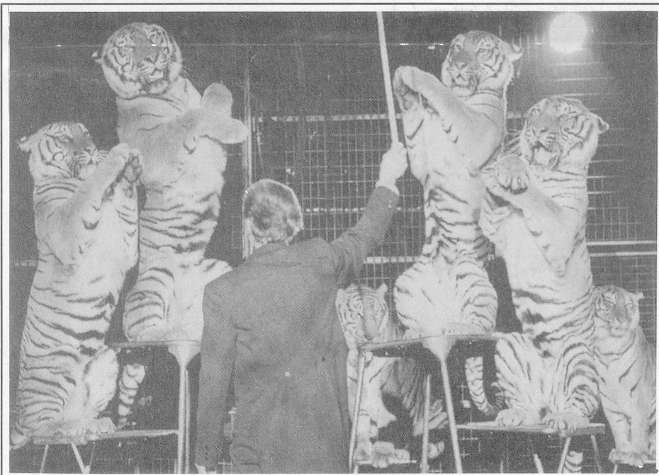
Bengali tigers during their act as part of Louis Knie's spectacular show.