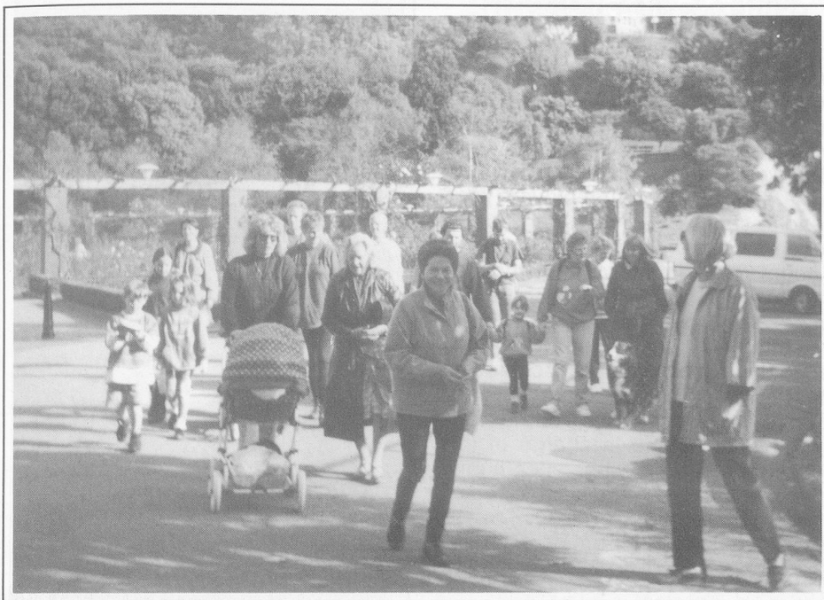
Our May Walk through historical Thorndon.