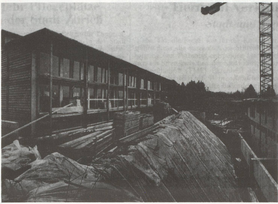
The houses under construction with the main materials being timber and lots of glass.

Apart from the typical Swiss chalets, practically all the housing construction in Switzerland has always been done in concrete or bricks.