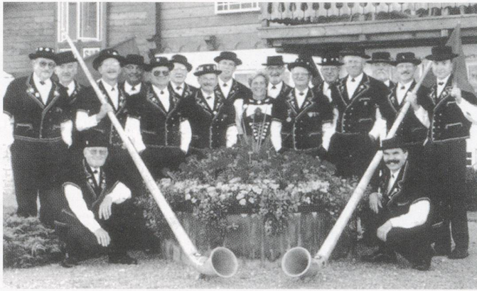
New Glarus Yodel Club (established in 1928)

The North American Swiss Singing Alliance will be held from June 12-15 in New Glarus, Wisconsin (America's "Little Switzerland") and the New Glarus Yodel Club (as hosts) would welcome you to attend the 37th triennial singing festival and competition of the North American Swiss Singing Alliance...planning a trip overseas? Why not visit New Glarus?