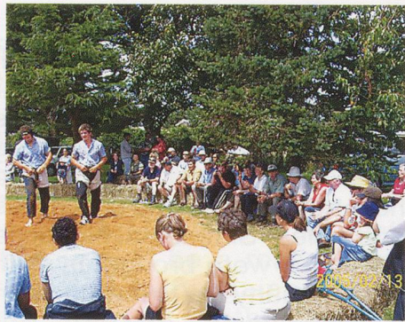
Two Swiss tourists battle it out in front of a captive audience.