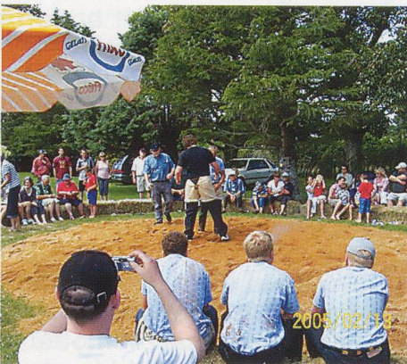
The wrestlers and audience at the Taranaki Swiss Club picnic 2005.