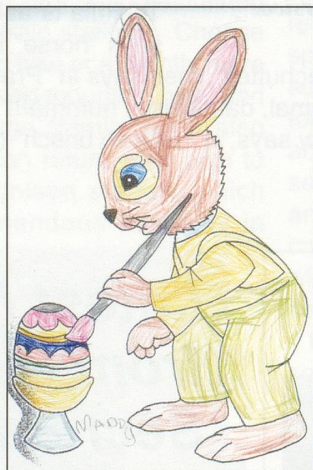
2nd - Maddy Meier (5)