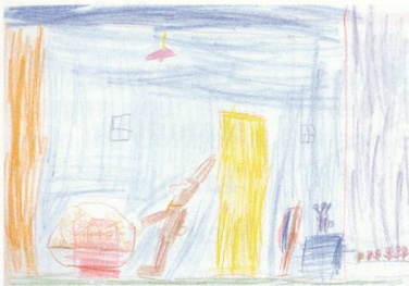
Jonas Padrutt (7)