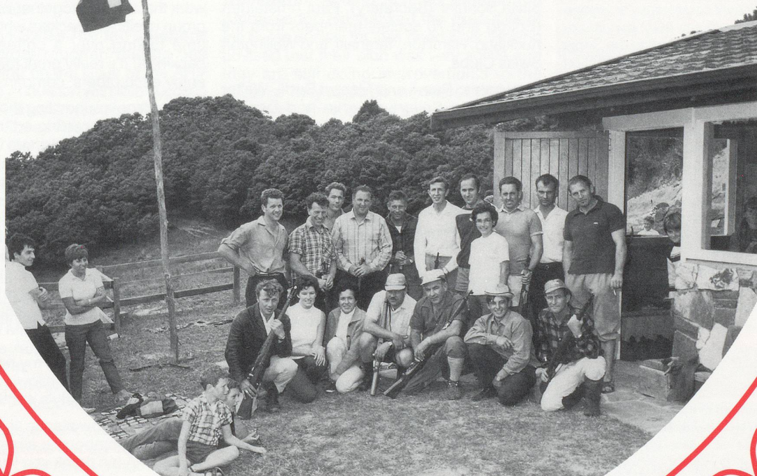
The People who made the Chalet happen

We are now preparing for the big gala evening on Saturday 7 October 2006, at the Springs, Western Springs, which should be a very special event and do us proud, and honour all the past and present members who are the pillars of this club. Let's celebrate!