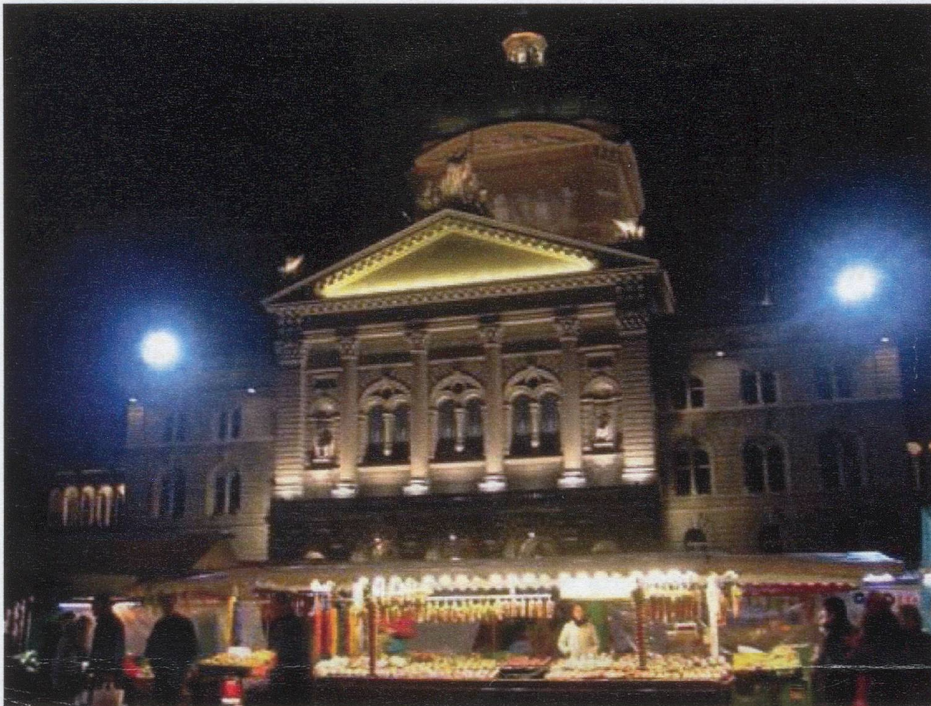
Market stalls in front of the Bundeshaus in Bern