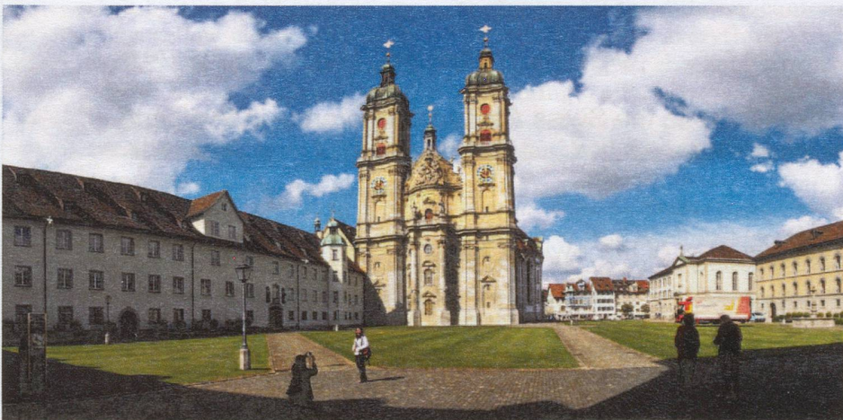
The present cathedral of St. Gallen was built in the 18th century

festival originated in old school customs celebrated on St. Gregory's Day, in memory of Pope Gregory I.