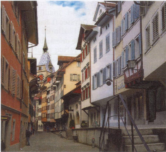
Zug's Old City with Zytturn

move towards trade and industry. The canton is now the richest in Switzerland.