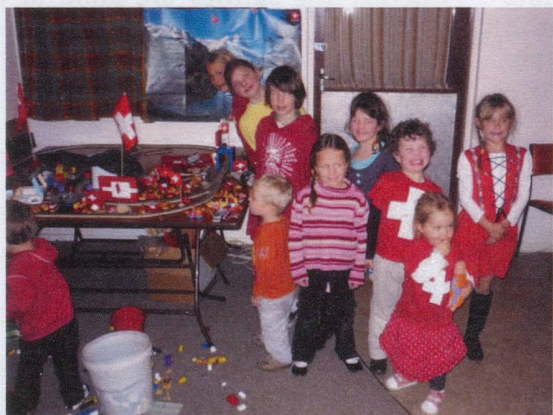
Wellington: Children's play table on 1st August evening