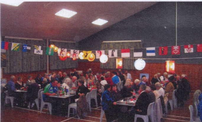
Hamilton: Group of about 100 at 1st August dinner