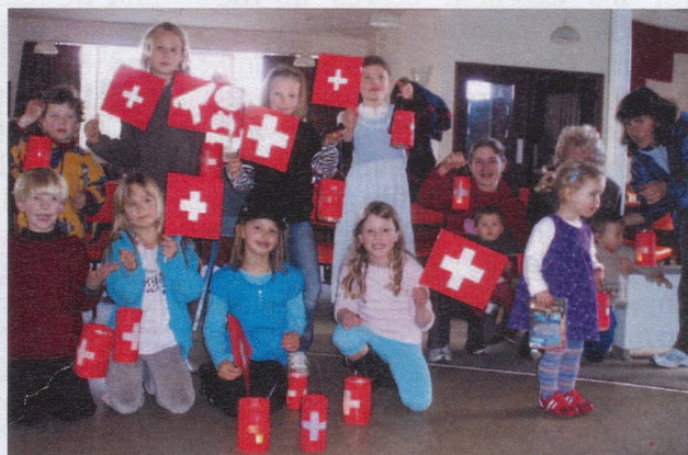
Children ready for the night