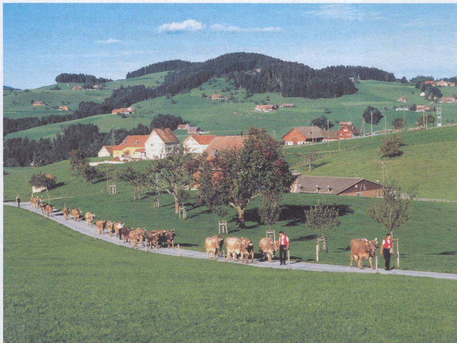
Pastoral landscape of Appenzell Innerrhoden

The name Appenzell means "cell (i.e. estate) of the abbot". This refers to the Abbey of St. Gall, which exerted a great influence on the area. By the middle of the 11th century the abbots of St Gall had established their power in the land later called Appenzell, which, too, became thoroughly germanized; its earlier inhabitants were probably romanized Raetians.