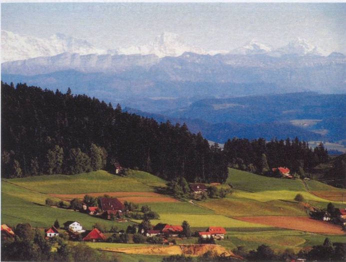
Emmental with 7 Hengsten Hohgant and Bernese Alps

The Bernese Midlands (Berner Mittelland) is made up of the valley of the river Aare, the river Emme, some of the foothills of the Bernese Alps, as well as the plain around the capital Bern, and has many small farms and hilly forested regions with small to mid-sized towns scattered throughout. It is perhaps best known by foreigners and visitors for the Emmental. The classic Swiss cheese with big holes, the Emmentaler, comes from this region's pastures of hilly and low mountainous countryside up to the 1,000m range. Mühleberg has a nuclear powerplant.