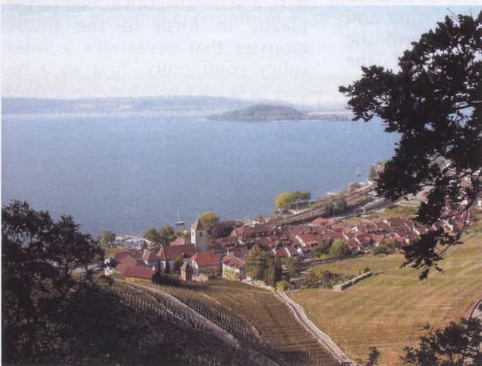
Twann with St. Petersinsel

In the north of the canton lies the Three Lakes Region (Seeland), concentrated around Lake Biel, Neuchâtel, and Murten, which rises from the plain up to the northernmost Swiss mountain chain of the Jura. The climate around the lakes is very pleasant. Many high quality wines come from here.