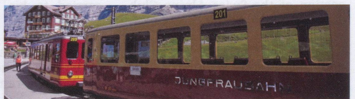
Train to the Jungfrau

The region also has an extensive train network as well as many cable cars and funiculars, with the highest train station in Europe at the Jungfrauoch and the longest gondola cableway in the world from Grindelwald to the Männlichen.