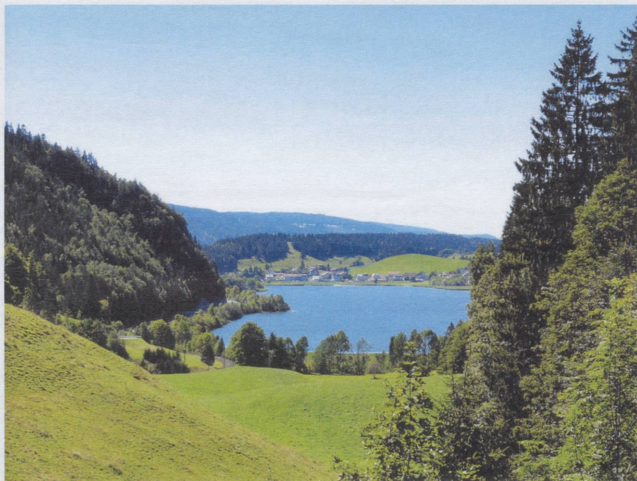
Vallée de Joux

The areas in the southeast are mountainous, commonly named the Vaud Alps. The Diablerets massif, peaking at 3,210 meters,