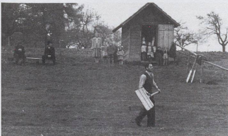
Hornussen in the 1950s

The sport probably developed in the seventeenth century. The earliest reference to Hornuss is found in the records of 1625 of the consistory of Lauperswil BE, in a complaint about the breaking of the Sabbath. Two men