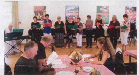
Swiss carol singing at the Danish House