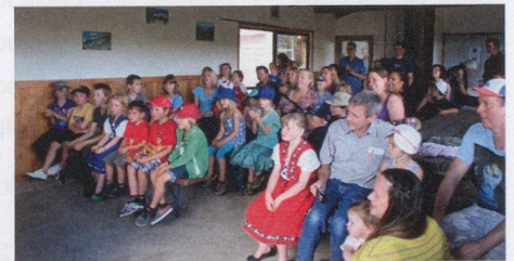
All eyes and ears