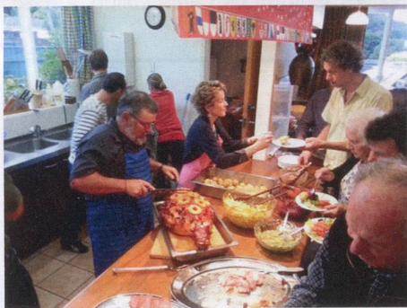
Delicious Christmas ham being served up