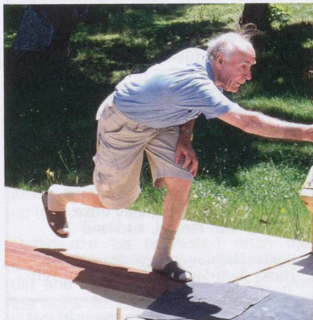
In full swing!