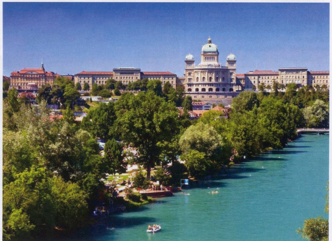
The Bundeshaus, with the emerald Aare River and the local "Marzili" swimming ground in the foreground