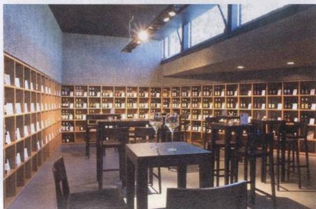
Lavaux Vinorama