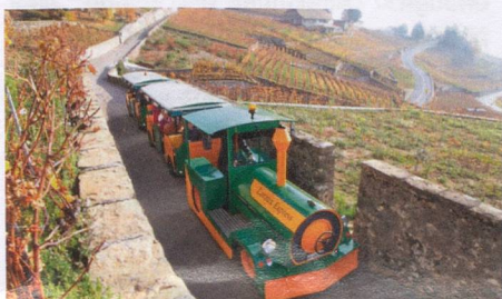
Lavaux Express ©www.lavauxexpress.ch