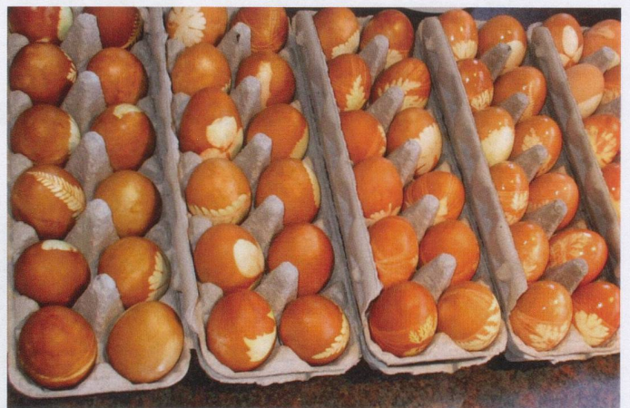
A beautiful selection of homemade Easter eggs à la Blaser Challenging all Swiss-Kiwi kids and also grown-ups to have a go!

We wish all our Readers enjoyable Easter celebrations.