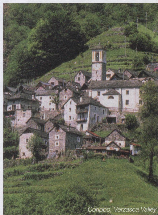
Corippo, Verzasca Valley

Lavertezzo lies on a marvellous stretch of the River Verzasca, with clean, intensively green waters gushing between bizarrely eroded rocks. The bridge in the village of Lavertezzo, is a popular destination for bathers and divers. It is often falsely called "The Roman Bridge" since its architecture with two arches only goes back as far as the Romanesque period in the 17th century. This stunning bridge is the starting point of various stunning mountain walks. UN