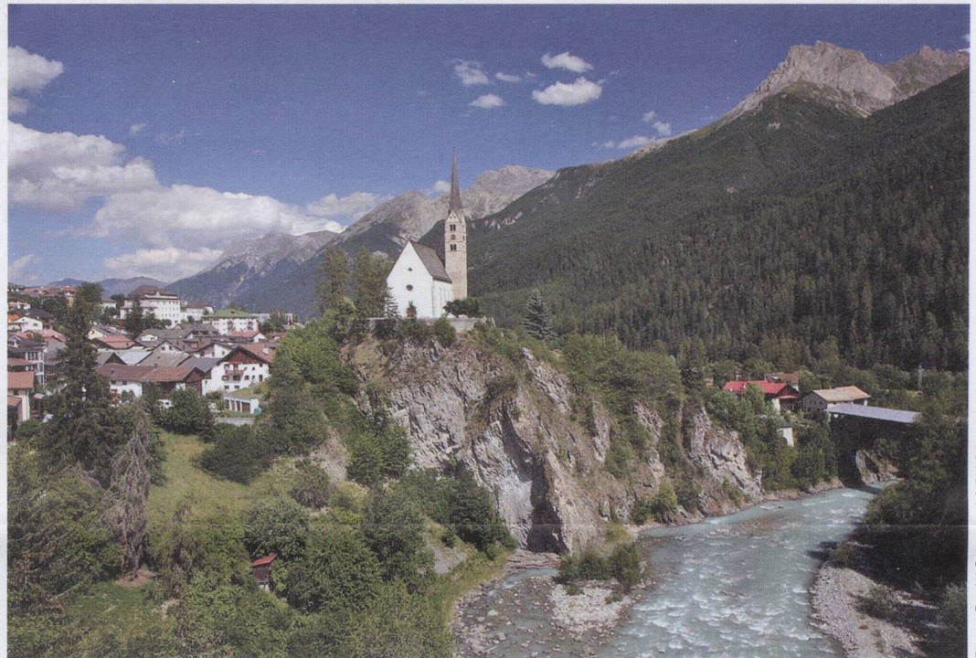
The village of Scuol in the lower Engadin, with the River Inn in the foreground

plus poems, Chuderwätsch and Consigli della Nonna