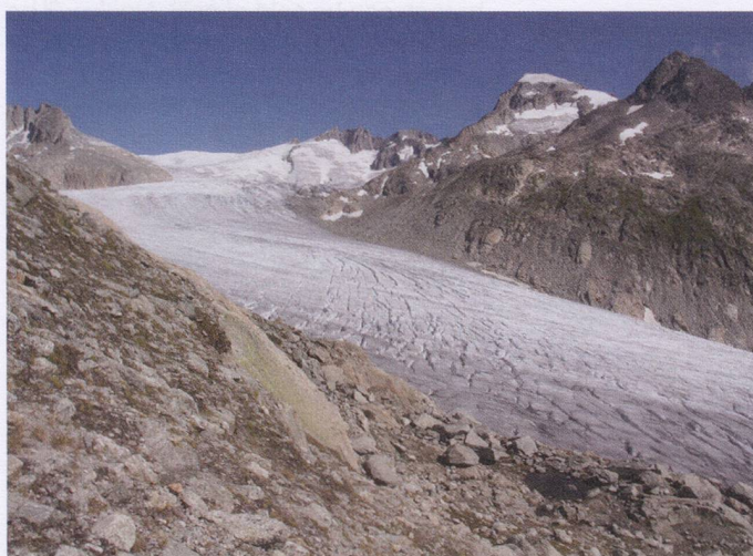
Rhone River arises from the Rhone Glacier