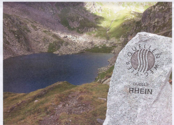
Tomasee – source of the Rhine