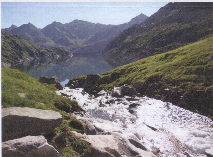
Reuss spring flows into Lucendro Dam