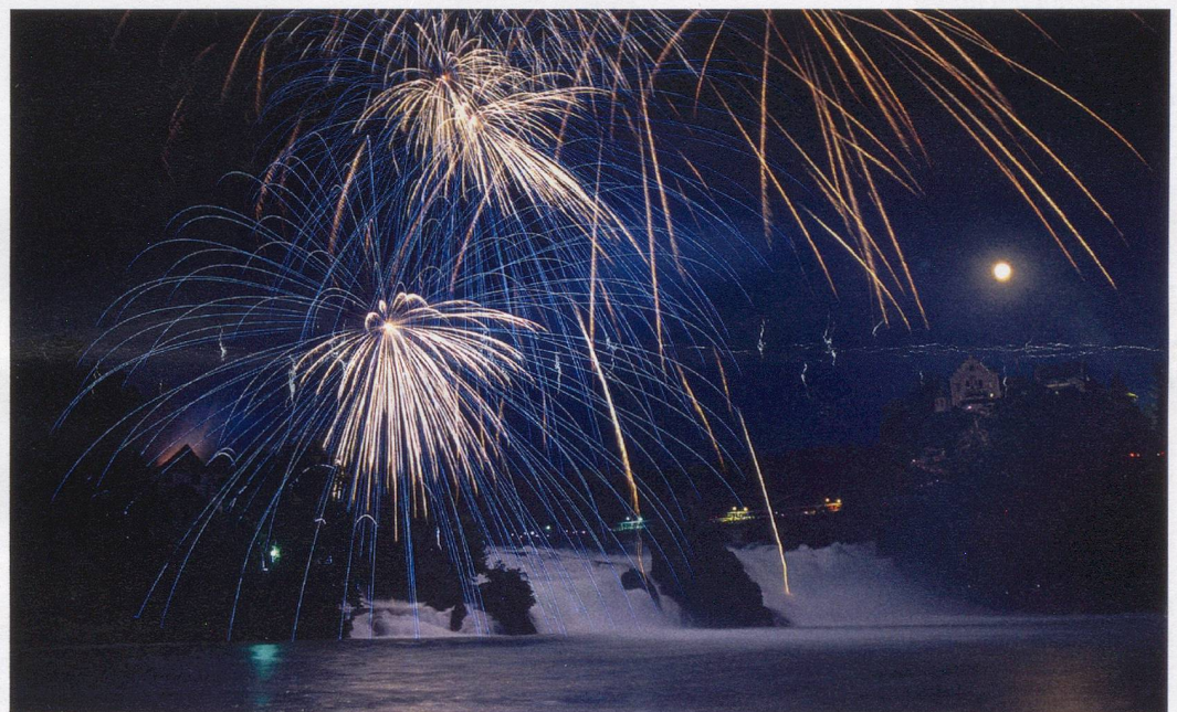
Photo Rheinfall celebrations

Since 1891, the first of August has been celebrated as Swiss National Day. The date refers to an historic alliance concluded in 1291 by the three cantons of Uri, Schwyz and Unterwalden. This alliance was to become the focal point around which the Switzerland of today was built over the next 500 years. Men from these three cantons "at the beginning of the month of August 1291" swore eternal allegiance to one another, promising mutual help and assistance. The alliance was mainly formed against the Habsburgs, who were striving to strengthen their position in the strategic region leading to the Gotthard Pass at the time.