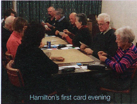
Hamilton's first card evening