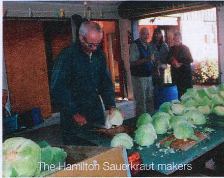
The Hamilton Sauerkraut makers