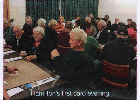
Hamilton's first card evening