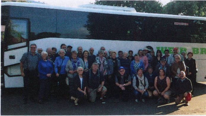
Taranaki members bus to the Swiss Market Day in Auckland