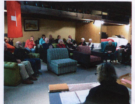
AGM Hamilton Club