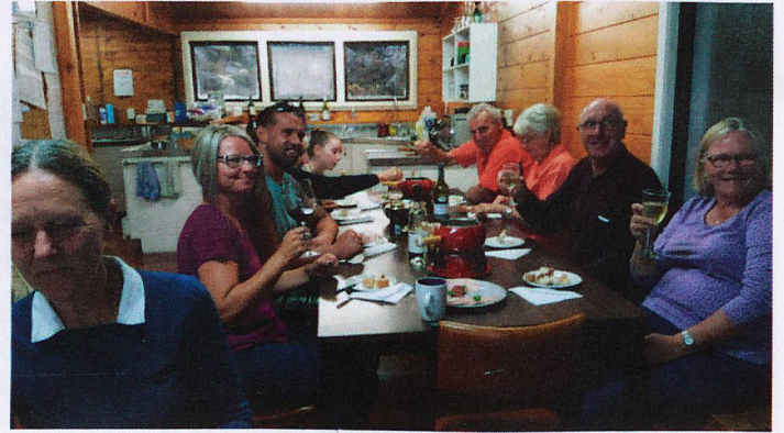
Fondue evening Mt Ruapehu Hut Auckland and Hamilton Clubs