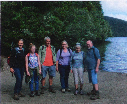
Hamilton hiking group at Lake Rotoponamu