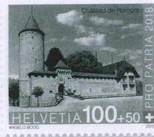
Sonderbriefmarke Schloss Romont CHF 1.00 + 0.50

Ab 17. Mai 2018 beschränkt gültig. Der Taxzuschlag von 50 Rappen kommt Pro Patria zugute.