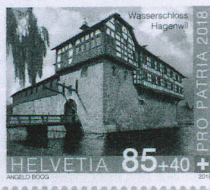
Sonderbriefmarke Wasserschloss Hagenwil CHF 0.85 + 0.40

Die Serie "Burgen und Schlösser der Schweiz" startete 2016 mit der Burg Zug und dem Schloss Neu-Bechburg. 2017 wurde sie mit dem Castello Visconteo und dem Schloss Oberhofen fortgesetzt. 2018 erscheinen nun die beiden letzten Sujets dieser Reihe: das Wasserschloss Hagenwil und das Schloss Romont